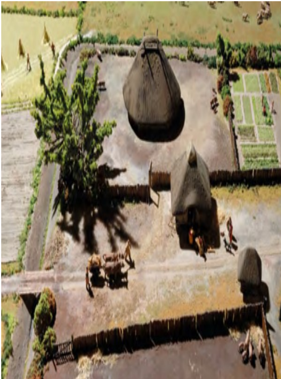
Maquette de la ferme de Bazoche-lès-Bray (Seine et Marne), II ème siècle avant J.-C. (Musée de Bibracte, réalisation : Lythos)