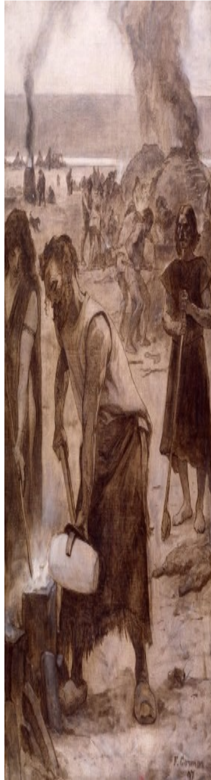
Fernand Cormon, Le Bronze et le Fer , esquisse pour l'amphithéâtre de paléontologie du Museum d'histoire naturelle de Paris, 1897, Paris, Petit Palais, musée des Beaux-arts de la Ville de Paris.