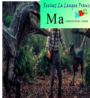
How To Fix Jurassic Park III, 2001, film américain réalisé par Joe Johnston avec Sam Neill.

Tu peux regarder cette vidéo du professeur Gamberge (clique sur l'image) :