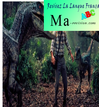
How To Fix Jurassic Park III, 2001, film américain réalisé par Joe Johnston avec Sam Neill.