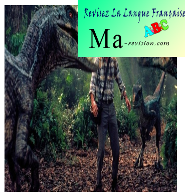
How To Fix Jurassic Park III, 2001, film américain réalisé par Joe Johnston avec Sam Neill.