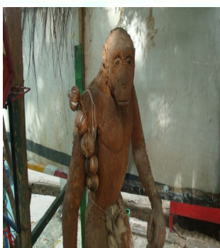
Sculpture représentant Toumaï au jardin Botanique de Ndjamena .