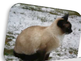
Un chat siamois dans la neige.

Le chat est un animal domestique. C'est un mammifère . Sa fourrure le protège du froid. Sa queue assure son équilibre. Ses moustaches lui signalent les obstacles dans l'obscurité. Le chat peut sortir et rentrer ses griffes : elles sont rétractiles . Sous ses pattes, les coussinets amortissent les chocs. Ils sont sensibles au froid et au chaud. Il existe plus de 40 races de chats : à poils courts ou longs.