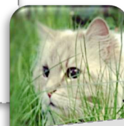
Les oreilles tournent en direction du bruit.