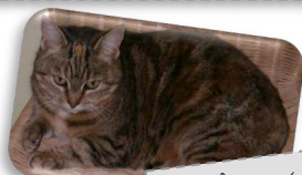
Un chat tigré