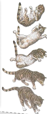
Il retombe toujours sur ses pattes.

Le chat est très adroit. Il peut se faufiler partout. Il a un très bon équilibre. Avec ses griffes, il grimpe facilement aux arbres.