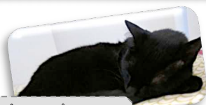
Le chat dort beaucoup.