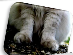
Les griffes sont rétractiles.