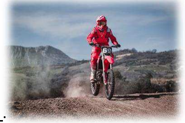
Aimes-tu ta moto?

Il y a 4 constructions possibles pour la phrase interrogative.