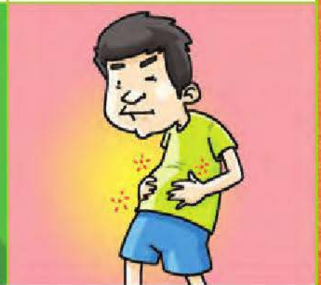
un mal de ventre