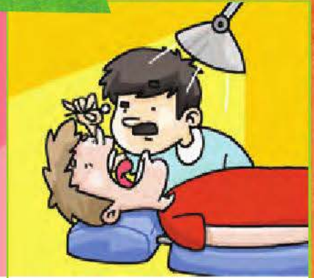
un mal de dent