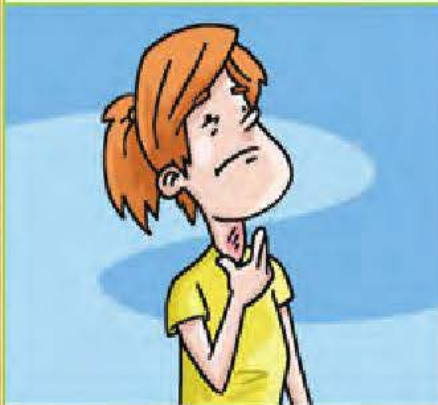
un mal de gorge