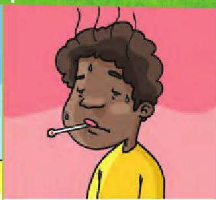
de la fièvre