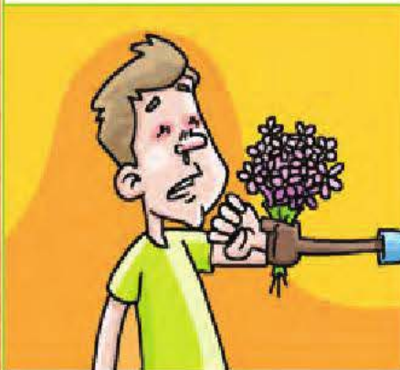
un rhume des foins