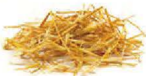
de la paille