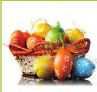
la fête de Pâques