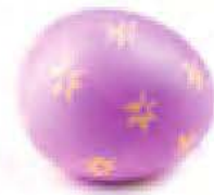
un œuf de Pâques