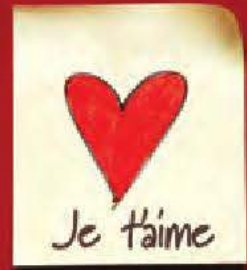
un mot d'amour