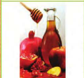
le Rosh Hashanah