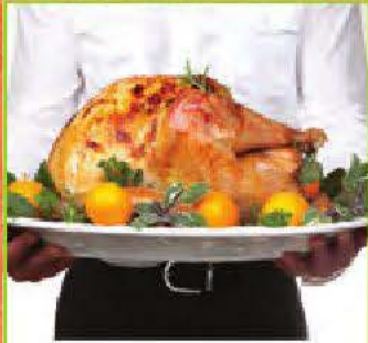
l'Action de grâce