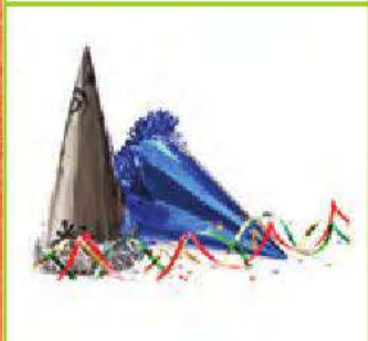
le jour de l'An