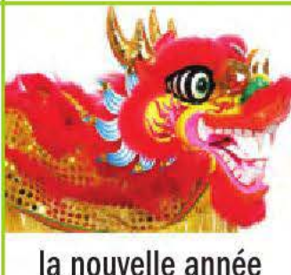
la nouvelle année chinoise