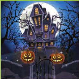
une maison hantée