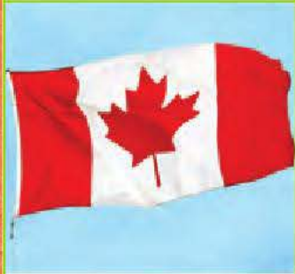
la fête du Canada