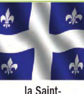
la Saint- Jean-Baptiste