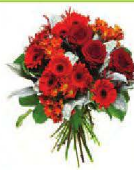
un bouquet de fleurs