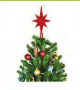
la fête de Noël