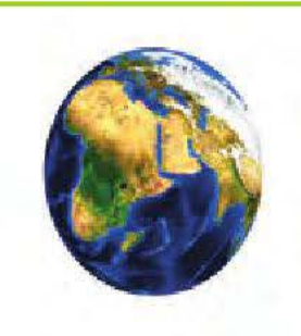
le jour de la Terre