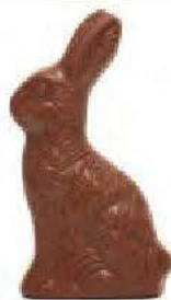
un chocolat de Pâques