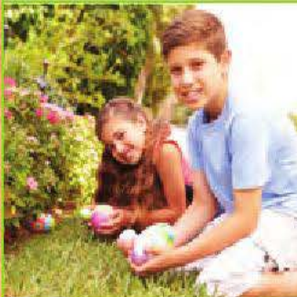
une chasse aux œufs