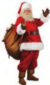
le père Noël