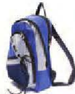
un sac à dos