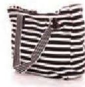
un sac de plage