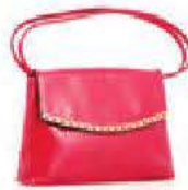
un sac à main