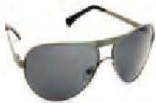
des lunettes soleil