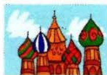
moscou (en Russie)