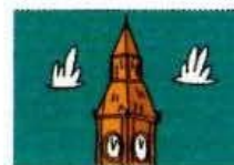
londres (en Angleterre)