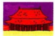
pékin (en Chine)