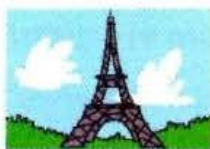
paris (en France)

4 Recopie ces noms de villes avec les majuscules : tu les trouveras dans l'exercice 1.