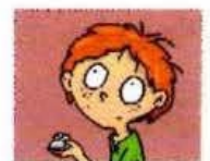
le ....etit ....oucet

4 Recopie ces noms de villes avec les majuscules : tu les trouveras dans l'exercice 1.