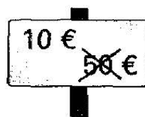
Ce n'est pas cher !