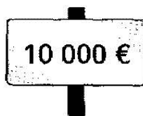
C'est cher !