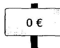
C'est gratuit !