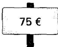
Le prix est sur l'étiquette.