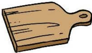
une planche à découper