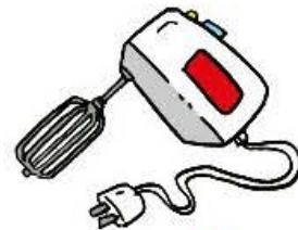
un batteur (électrique)

2 Écris le mot étiquette correspondant à chaque liste de mots.