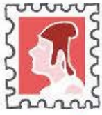
un timbre .

le nom de chaque dessin en assemblant des étiquettes.