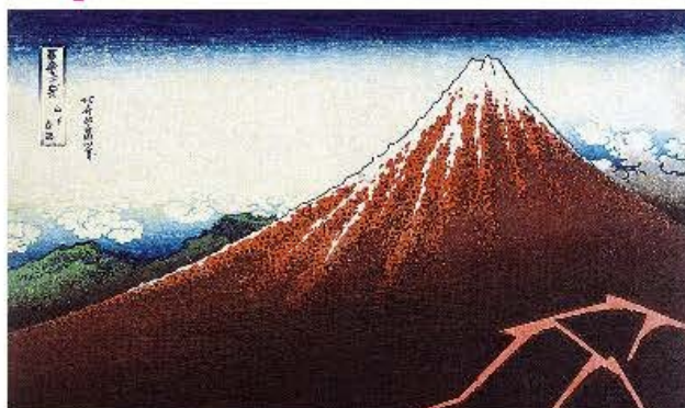
Katsushika Hokusai, Le mont Fuji.