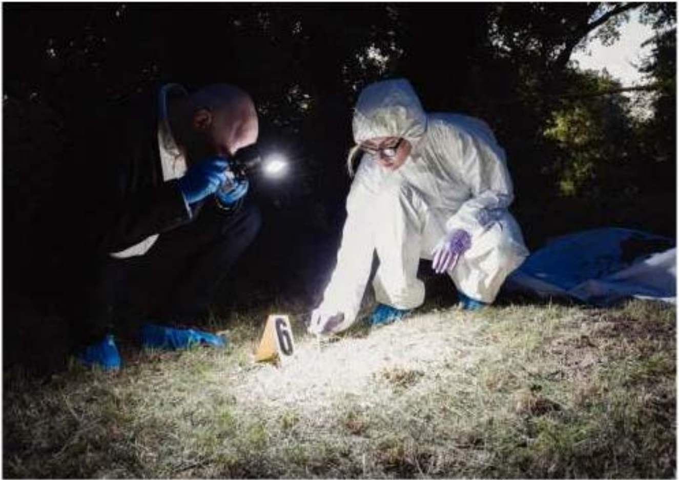
Un photographe et une enquêtrice de la police scientifique enquêtent sur un vol.