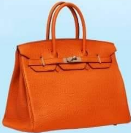
un sac à main