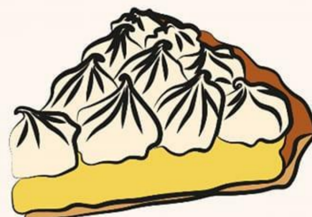
Tarte au citron