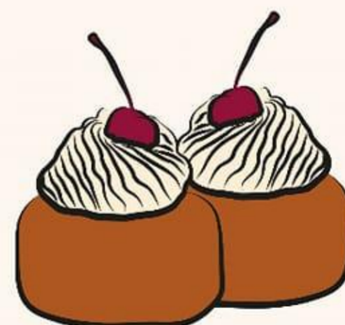
Babas au rhum