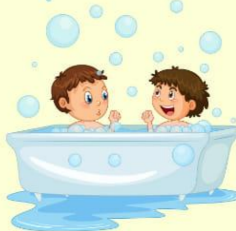
Ils se douchent