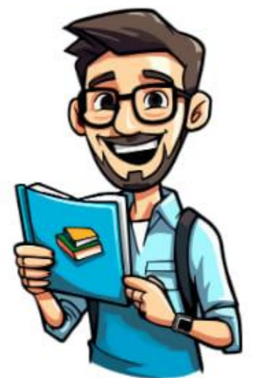
C'est un professeur