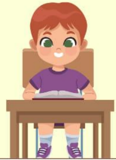
C'est un garçon. Il lit.