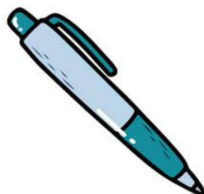
C'est un stylo