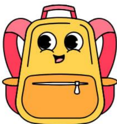
C'est un cartable