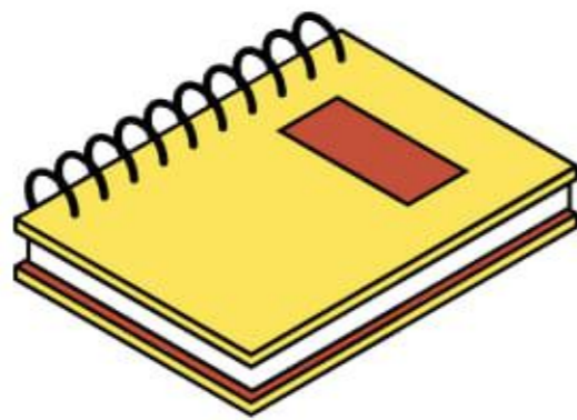
C'est un cahier