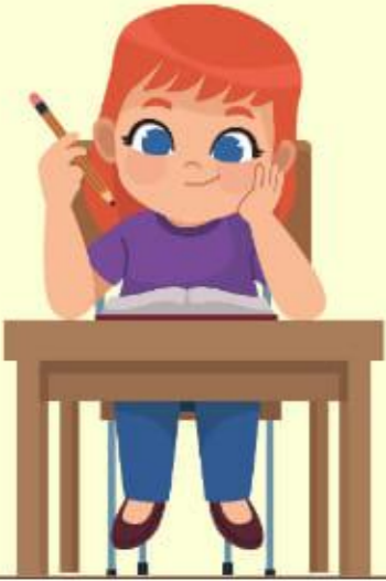
C'est une fille. Elle écrit.