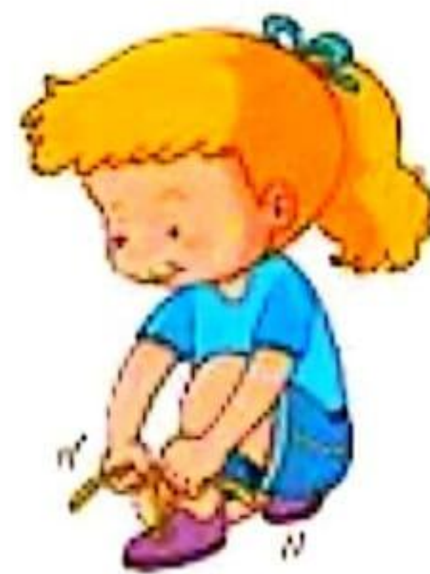
lacer ses chaussures