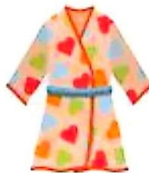
la robe de chambre