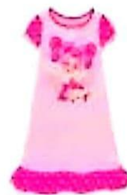
la chemise de nuit