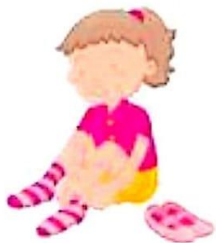
enfiler des chaussettes