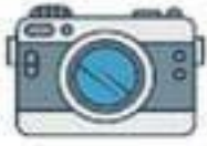
Un appareil photo numérique