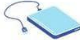
Un disque dur