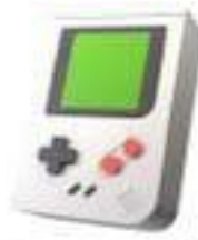
Une console de jeux