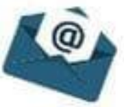
Le courrier électronique