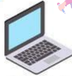
Un ordinateur portable