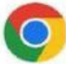
Un moteur de recherche