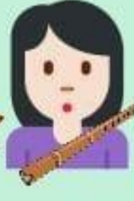
de la flûte