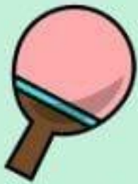
le tennis de table