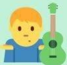
de la guitare