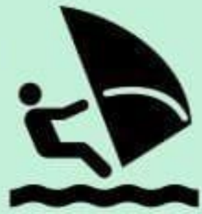
la planche à voile