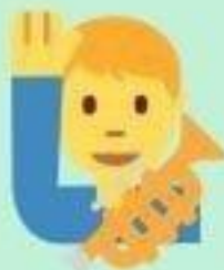
de la trompette