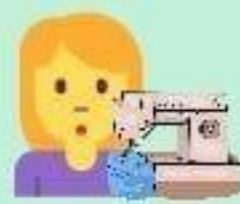
Coudre / Tisser