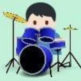
de la batterie