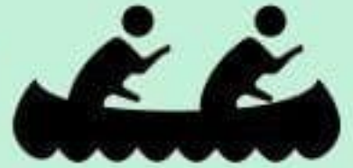
le canoë- kayak