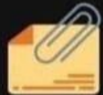
une pièce jointe