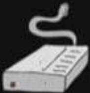
un disque dur