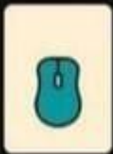
un tapis de souris