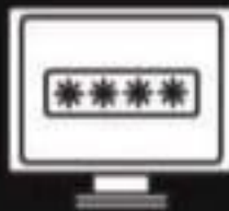
un mot de passe