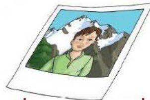
la pho to gra phie