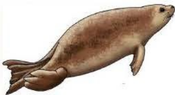
un pho que