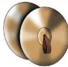
des cym ba les