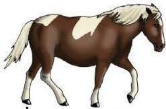
le po ney

Faites observer que dans yoyo, yaourt, hyène, yourte, yeux, le son est identique à io, ia, iè, iou, ieu.