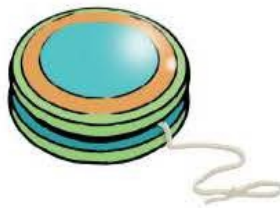
un yo yo