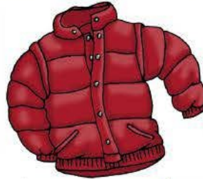
l' a no rak