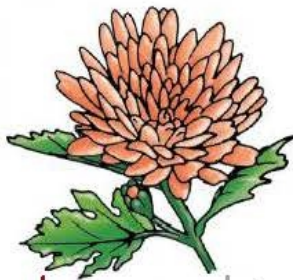
le chry san thème