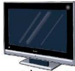
la télévi sion