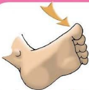
les or teils