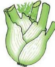
du fe no uil

les or te ils l' é ven tail du fe no uil