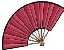
l' é ven tail