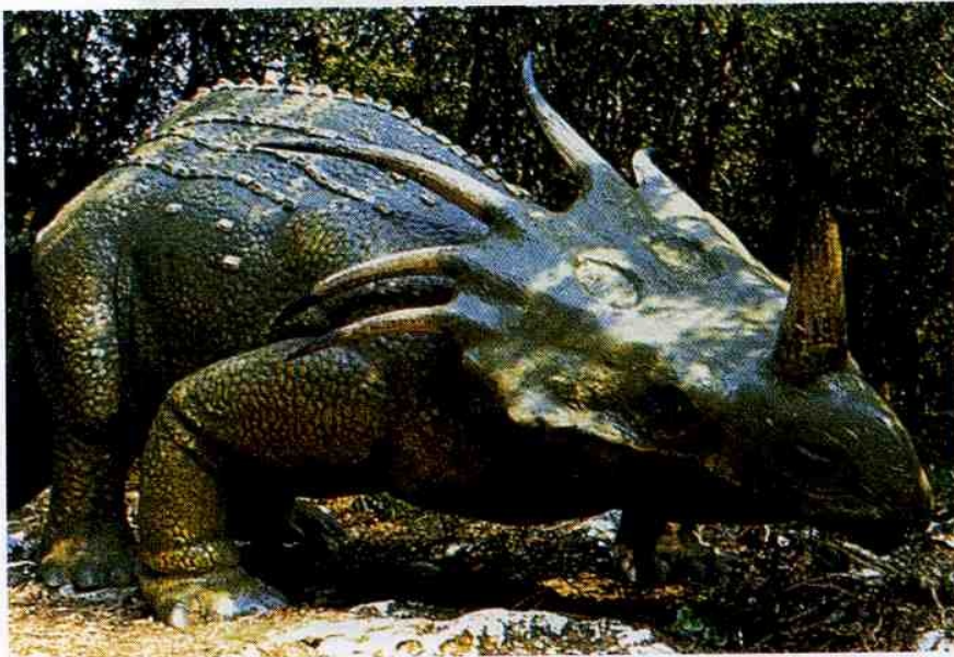
Reproduction d'un tricératops

Les paléontologues cherchent la réponse. Ils fouillent le sol pour trouver des indices dans les restes et les traces que les dinosaures ont laissés.